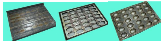
その他サイズもご相談下さい